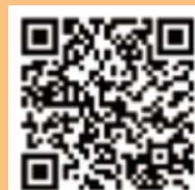
▲山口県公式ウォーキングアプリ