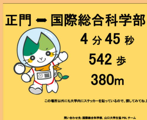
▲ヤマミステッカー

キャンパス内に歩数などを示した ヤマミステッカー を配置！ さらに、講義室や食堂などへの距離 や所要時間を分かりやすくまとめた キャンパスマップ の配布も行います。