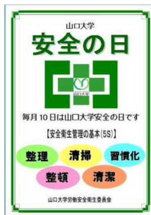
図 5 山口大学安全の日ポスター

平成 18 年度より、毎月 10 日は「山口大学安全の日」とした。この安全の日は、月に 1 回は 5S チェックをしようと呼びかけるものである。ポスター(図 5)を作成し、自主的な安全活動を促している。