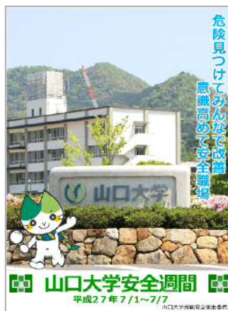
図 3 H27 安全週間