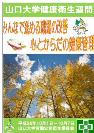
図 2 H26 健康衛生週間