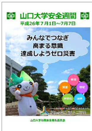
図 1 H26 安全週間