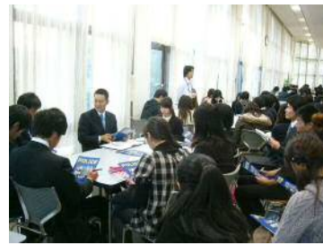
人事院・国家機関説明会。食堂さらに各省庁のブースを開設しました