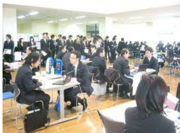
食堂ブース方式。11月～2月に吉田・常盤両キャンパスで開催。写真は常盤キャンパス食堂です

学内業界・企業研究会とは、山口大学の学生が、業界動向や会社・仕事をより深く、よりリアルに理解できるよう、経営者・人事担当者、また、本学の卒業生など会社等でご活躍の皆様をキャンパスにお招きして開催する研究会です。本学ではこの学内業界・企業研究会をキャリア教育の一環と位置づけており、学生たちはこの機会を活用して、幅広く業界・企業を研究し、就職活動ならびに自身のキャリア形成に役立てることを期待しています。