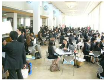
やまぐちday。11月と2月に吉田・常盤両キャンパスで開催しました。