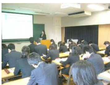
教室セミナー方式。11月～2月に開催しました。写真は共通教育棟です。

平成24年度は、11月～2月の開催期間中のべ477社、学生7124人参加の研究会を、盛大に開催しました