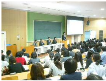
11月のジョブスタディ。大手5社の人事担当者にお話をいただきました

学内での学びの機会を大切に！ 多くの企業・官公庁にご協力をいただきながら、働くことをしっかりと理解する。山口大学が力をいれる取り組みのひとつです。