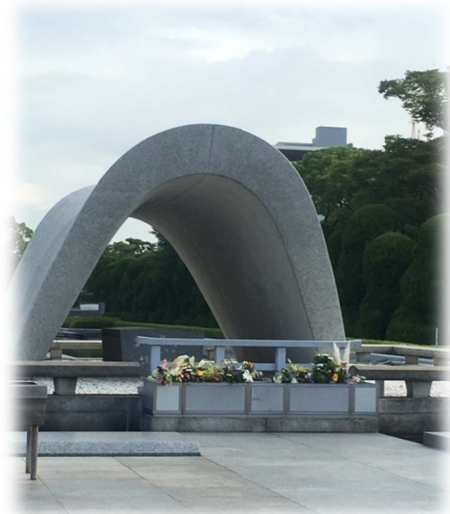
朝早くでしたがお花がたくさんでした。