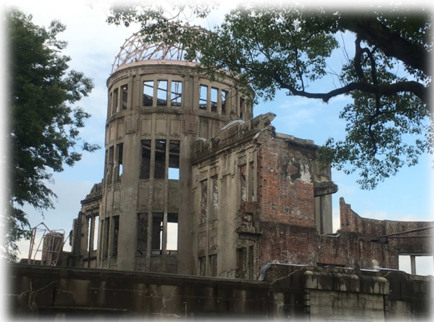
爆心地にほど近い原爆ドーム

今年はオバマ大統領が広島を訪問した記念すべき年でもありました。慰霊碑に献花し、「核兵器のない世界」に向けた所感を述べ、被爆者代表と抱擁を交わしたそうですね。