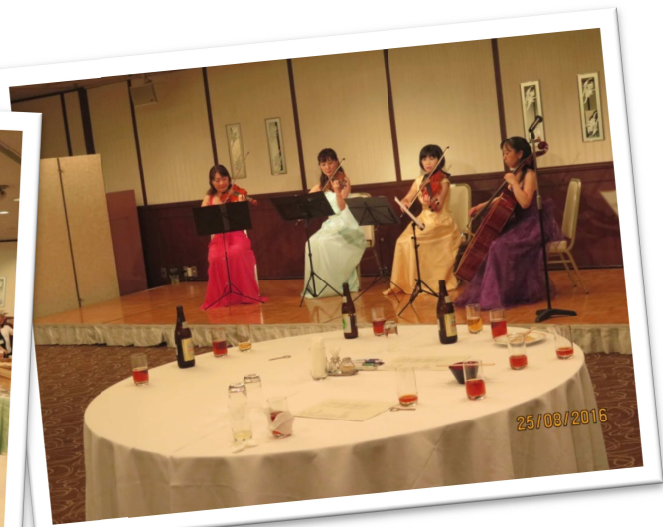
四重奏素敵でしたね♡ 心があられます。