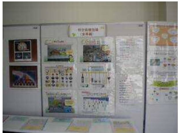
写真はほんの一部です