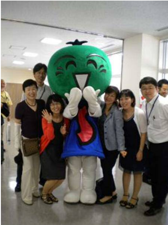
ゆるキャラ すだちくん☆