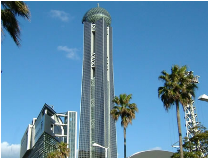
海峡メッセ、海峡ゆめタワー

来年度は山口県下関市 海峡メッセにて第49回全国大学保健管理研究集会が開催されます。皆様、ぜひご参加下さい。また、運営に際しいろいろとご協力をお願いすることもあると思いますがどうぞよろしくお願いいたします。