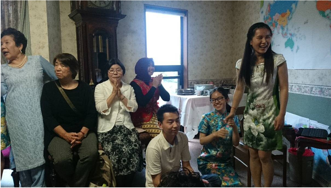
最近のチャイナドレスはミニ丈、りゅう れん 可愛い！