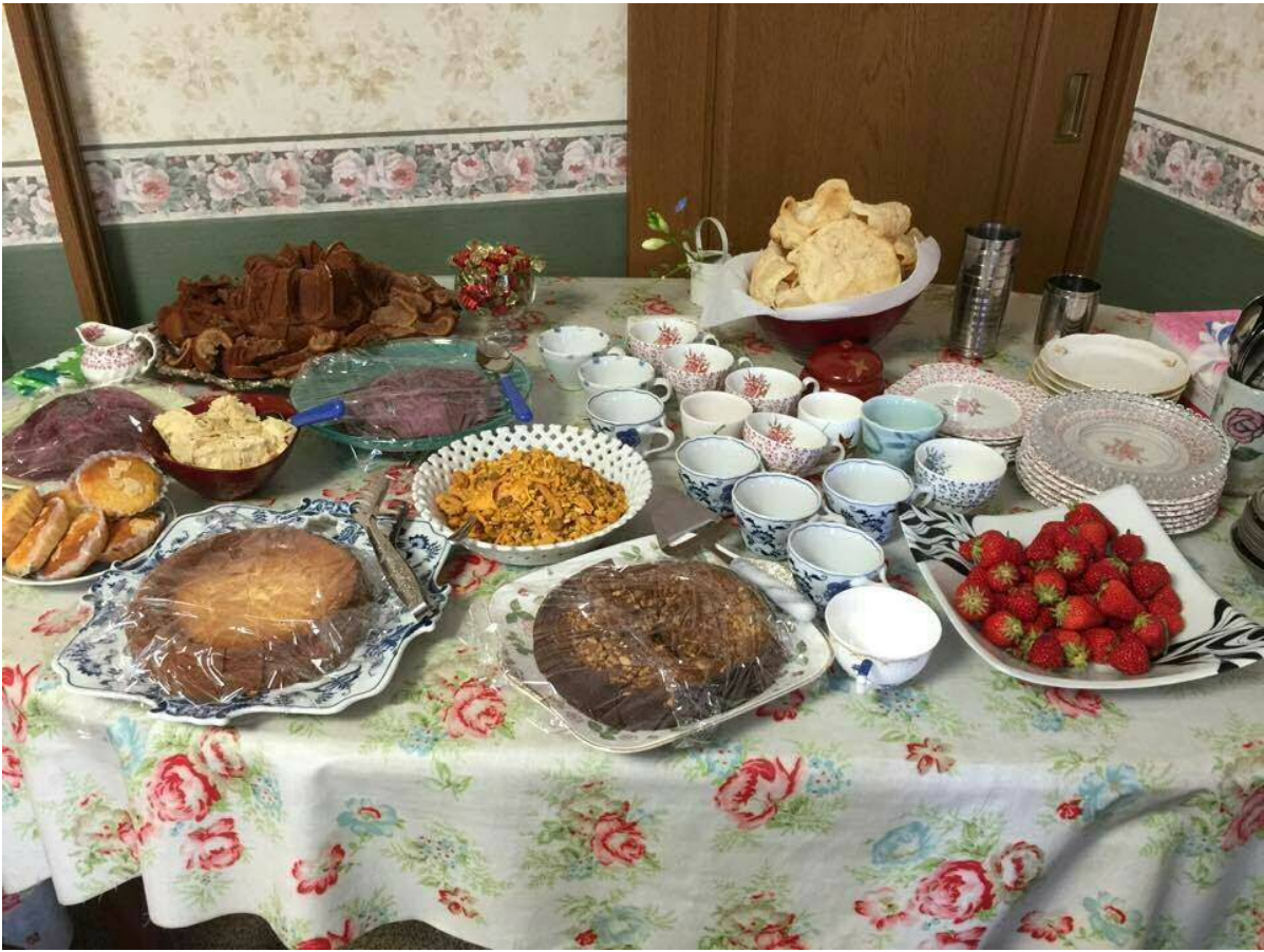
チーズケーキ、チョコレートケーキ、マドレーヌ、チェコのお菓子バーボフカ、サマープディングなど。