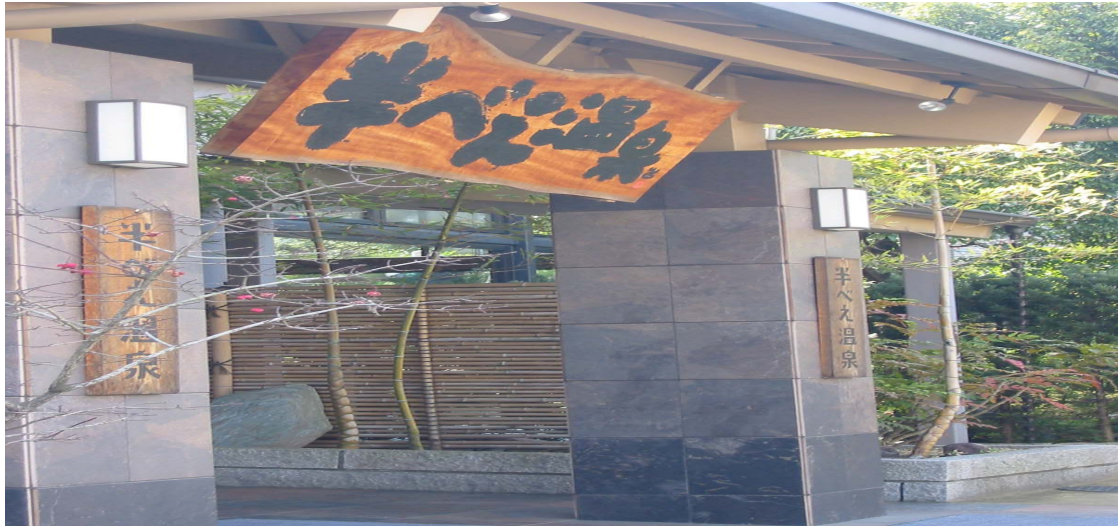
広島市南区本浦町 半べえ温泉