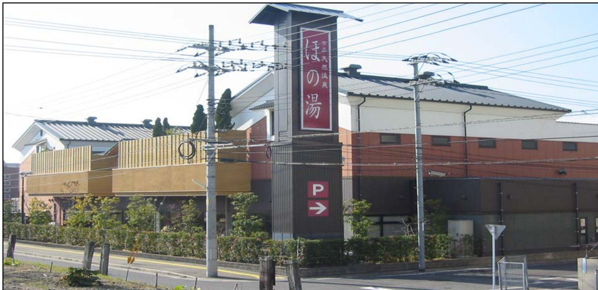
広島市南区宇品東 ほの湯