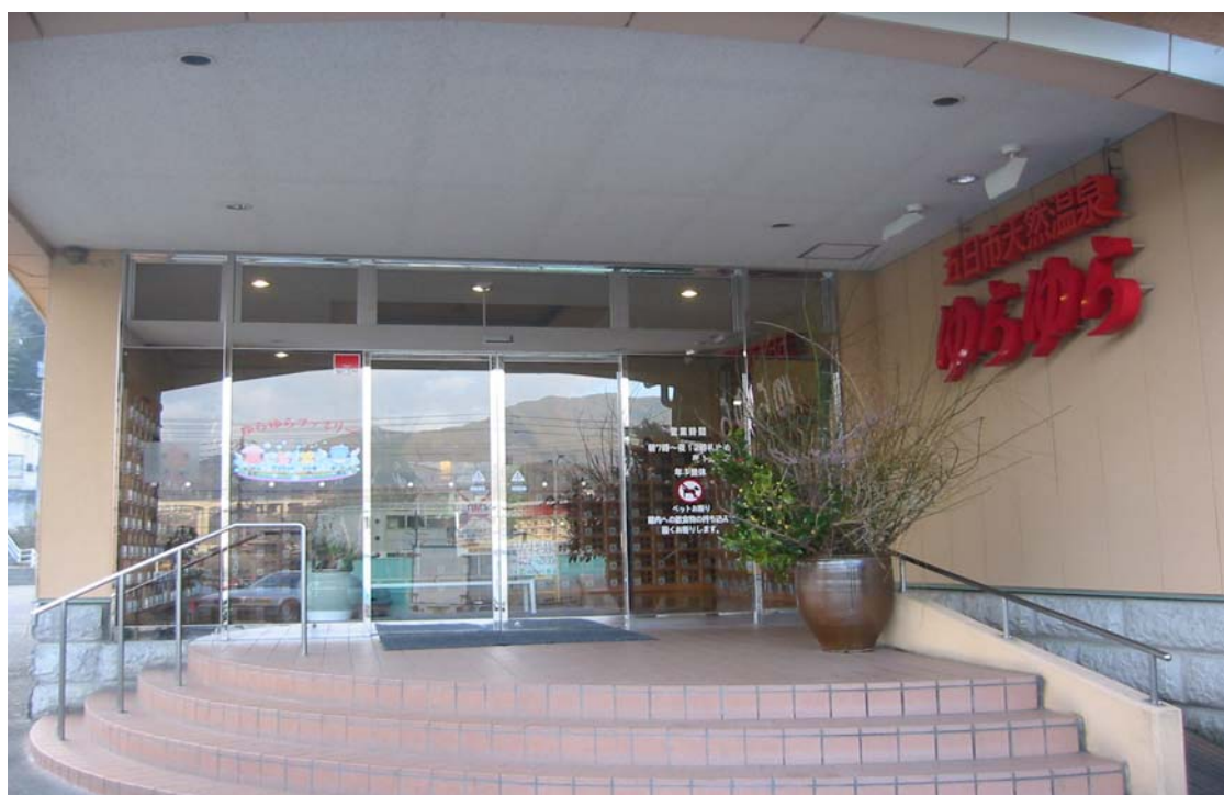
広島市佐伯区八幡 ゆらゆら

今日は、「わたしの癒し」ということで、広島近郊に手軽に行ける天然温泉を紹介させて頂きたいと思います。その中でも、よく利用する最近でいうスーパー温泉です。中を紹介出来ないのが残念なのですが・・・ホームページで検索して見て下さいね。