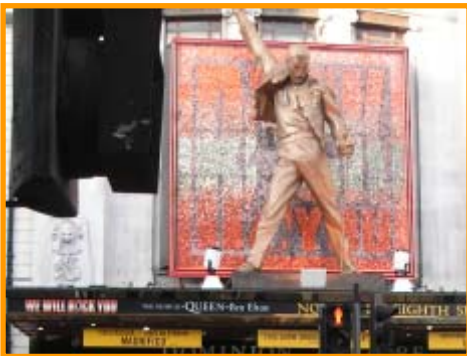
会場に立つフレddie・マーキュリー像 (Queen ボーカル)

イギリスの伝説のロックバンド Queen の代表ナンバーをもとに話が進みます。生演奏付の舞台はまるでライブ会場のようなようです。「ロック」が忘れ去られた近未来の世界で音楽を取り戻すためにボヘミアン軍たちが戦います。