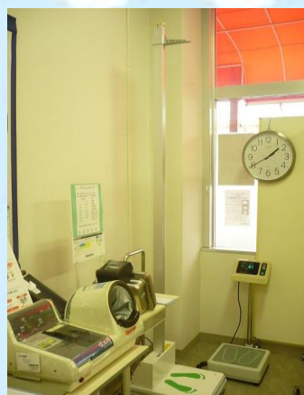
↑ 身長、体重はここで測ります