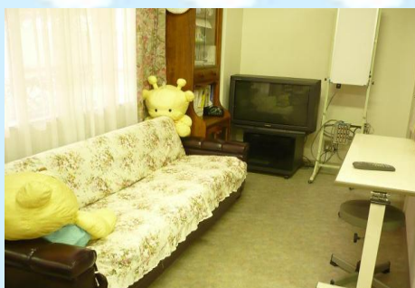
↑ ここでビデオを見るができます