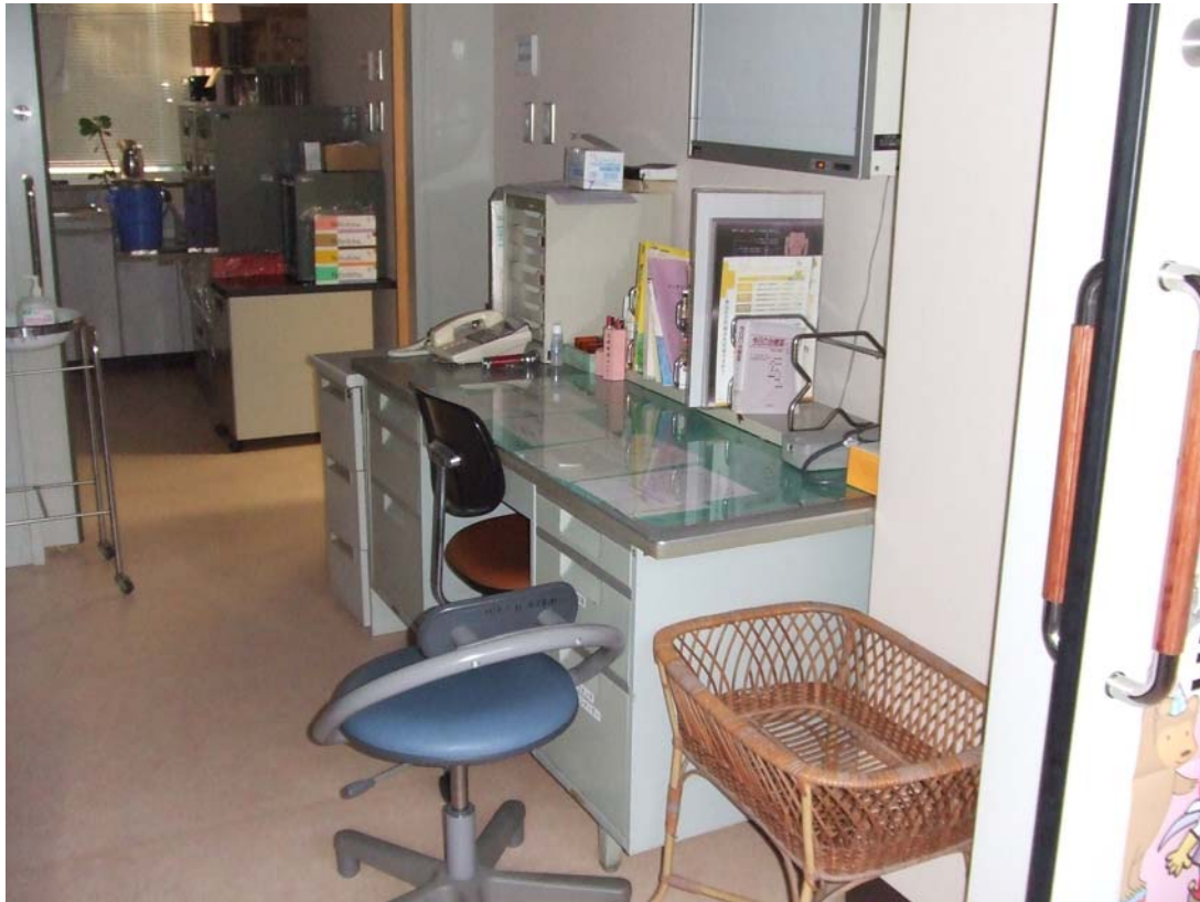
ふと診察室に目をやると、奥に処置室が見えます。