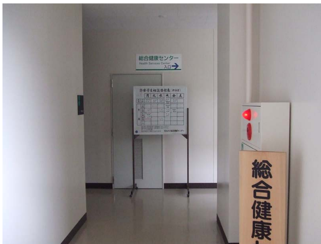
ここを右へ曲がると. . . ,