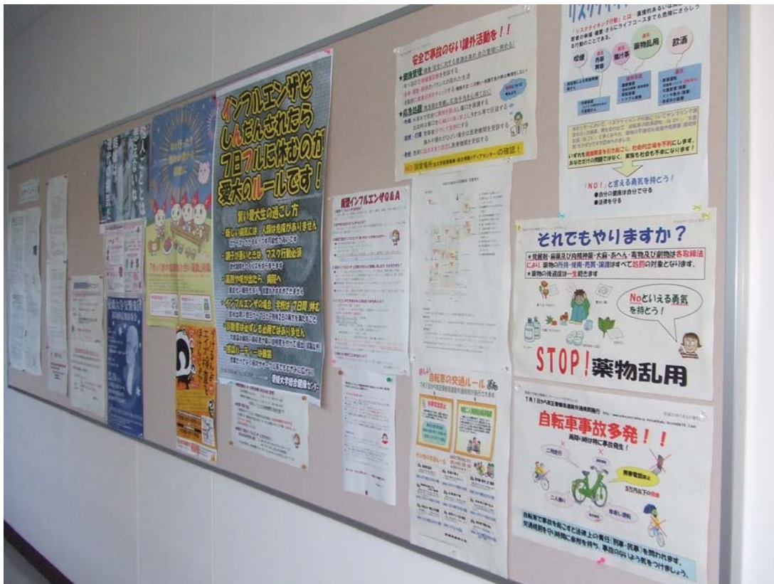
第二の入り口前の廊下にある掲示板。 貼ってあるのは、センター長をはじめ、スタッフ作成の力作ばかりです。