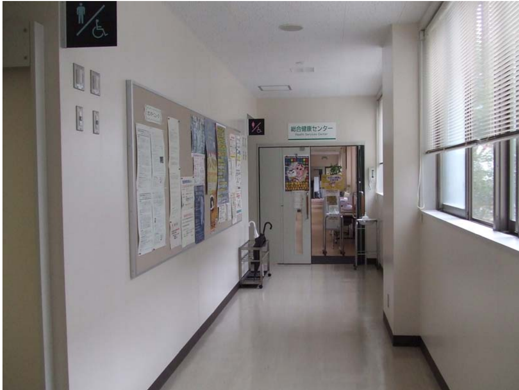
第二の入り口が見えてきました。