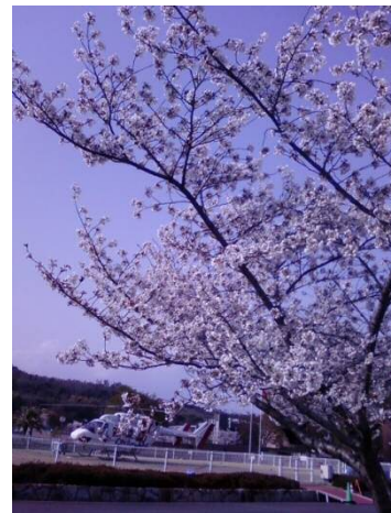
ドクターヘリと桜❀

川崎医療福祉大学は昨年、20 周年を迎え、建学の理念を受け継ぎ、さらに発展させる新たなスタートにする決意を致しました。