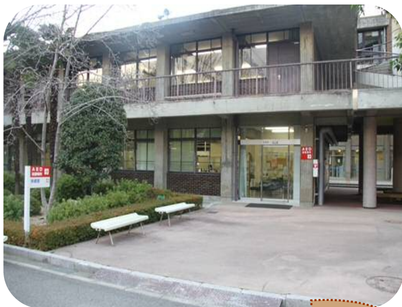
保健室の外観です☆