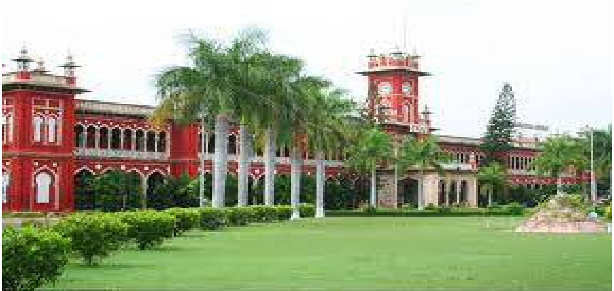
Tamil Nadu Agricultural University

TNAU is one of the best agricultural universities in India and it offers various degree programs at under-graduation, graduation and post-graduation level. Its main campus is in Coimbatore, and also has 8 other sub-campuses which are spread all over the state. Besides, the university has 36 research stations for agro-technology development and 14 Farm Science Centers for extension of technology. The total 3500 students are taking education in the university and the entire academic and research activities were done by more than 1000 scientists and teachers with the help of more than 1000 supporting staff.