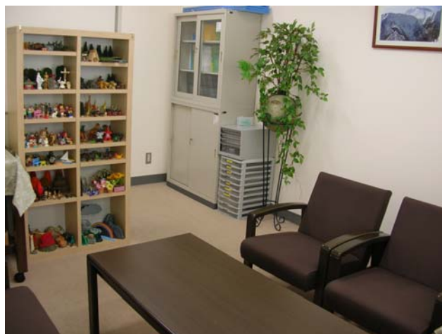
棚のカーテンをはずして箱庭アイテムも写してみました。