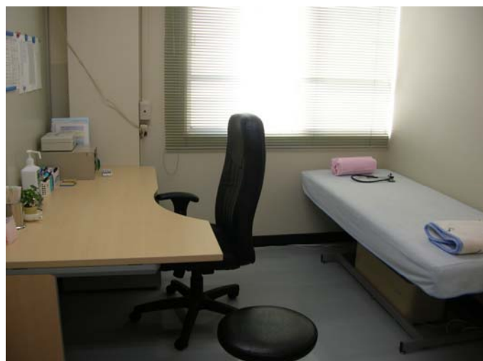
保健室の中になりました。ここは診察スペースです。