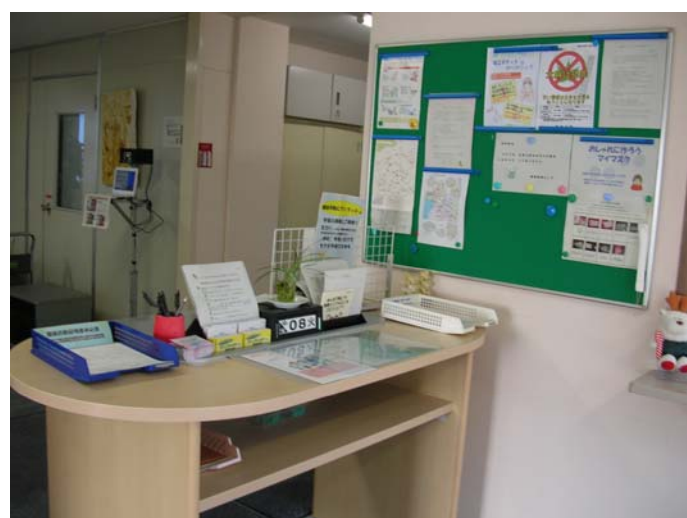
受付のカウンターです。