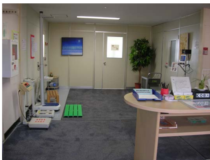
エントランスのオープンスペースです。休み時間には身体測定する学生で賑わいます。