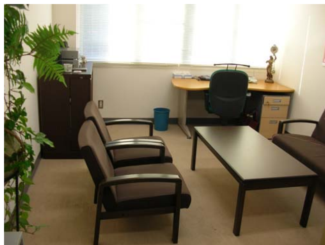
カウンセリングルームです。