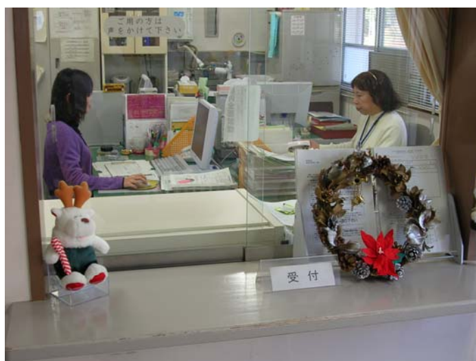
受付窓口から覗いた事務室です。ナースチーム2人が座っています。 学生さんからはこんな風に見えるんですね～私達。