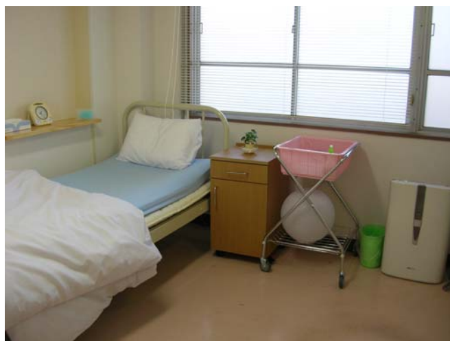
最近、改装された休養室です。空気清浄機も置いています。