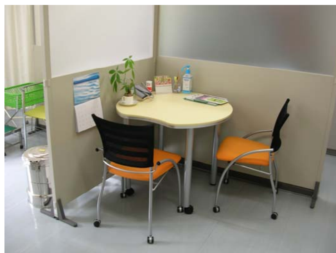
保健師・看護師による相談スペースです。