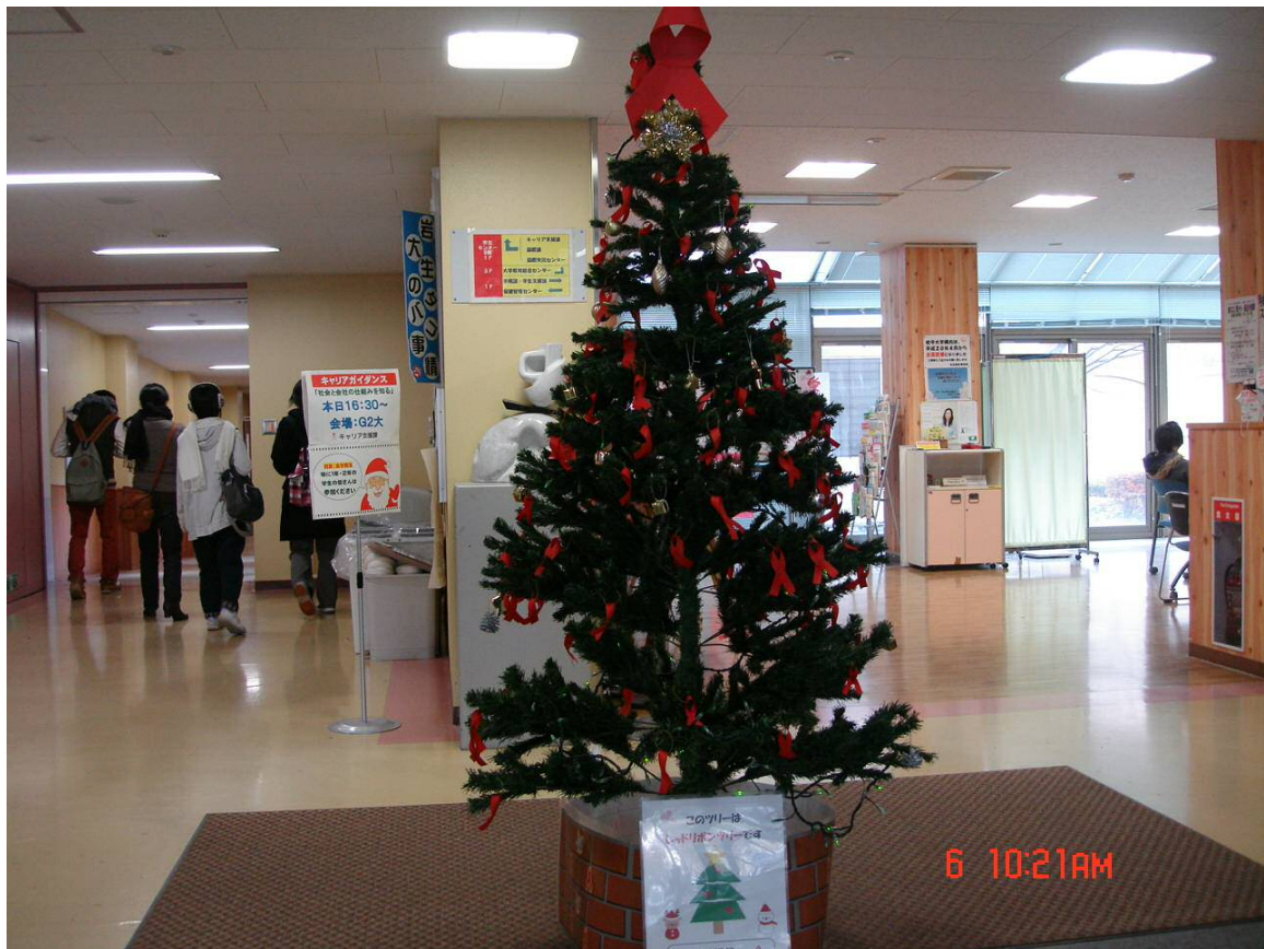
エイズデーのレッドリボンツリー 岩手大学保健管理センター前に毎年設置します。