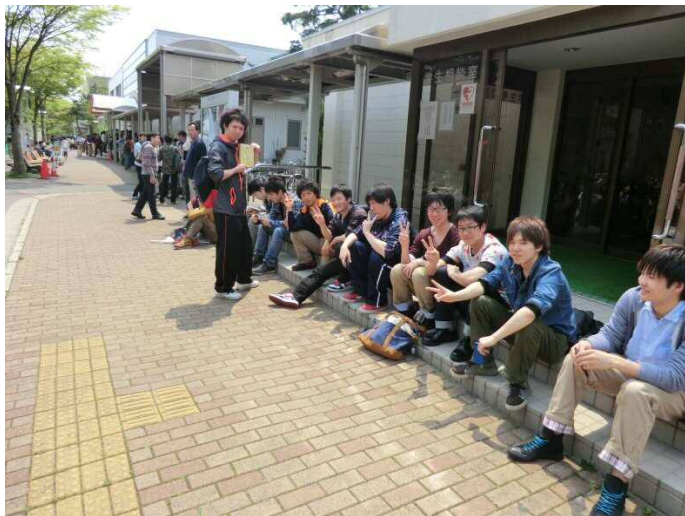
【春の健診風景】受付が始まるのを待っています 左手に見えるのが生協とそれに続くアーケード