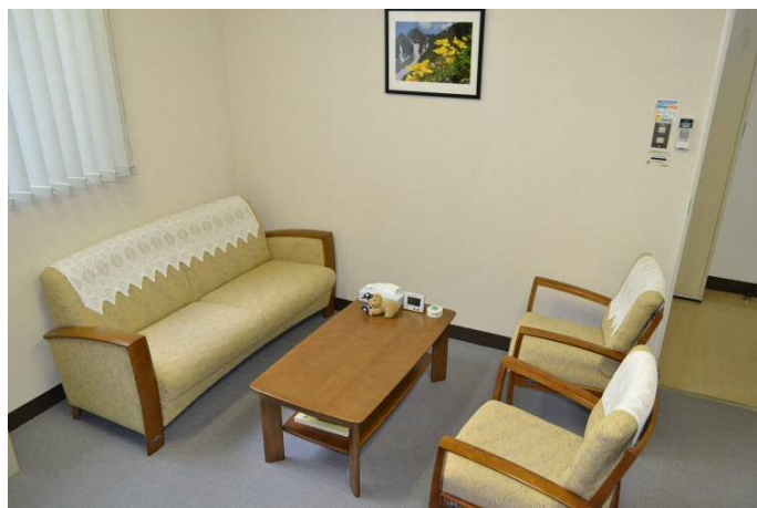
【相談室】2部屋あります