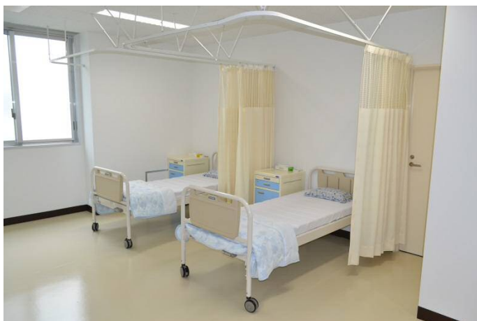
【休養室】ぐっすり眠ってしまう学生もいます