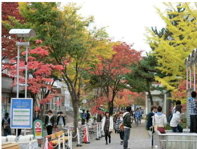
【秋の風景】街路樹が紅葉します たまに天然記念物のカモシカも散歩していたり!? 偶数回見るとセーフ、奇数回見ると留年という、 噂が語り継がれているようです。