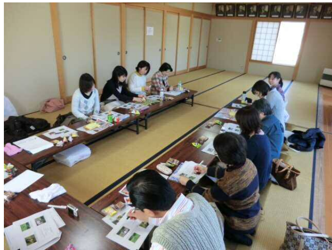
【研修風景】就職推進課と総合学務課との 合同研修会を企画しています スタッフ間の交流も深まり、楽しい時間です