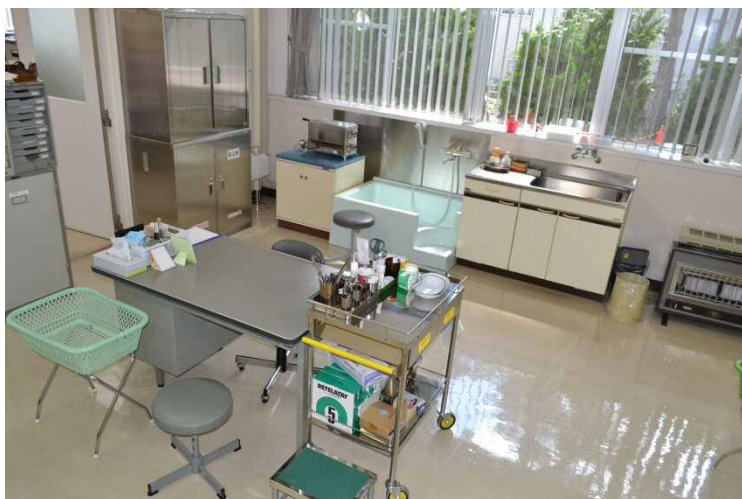
【処置室】奥に見えるのは足のケガで大活躍の洗い場です。