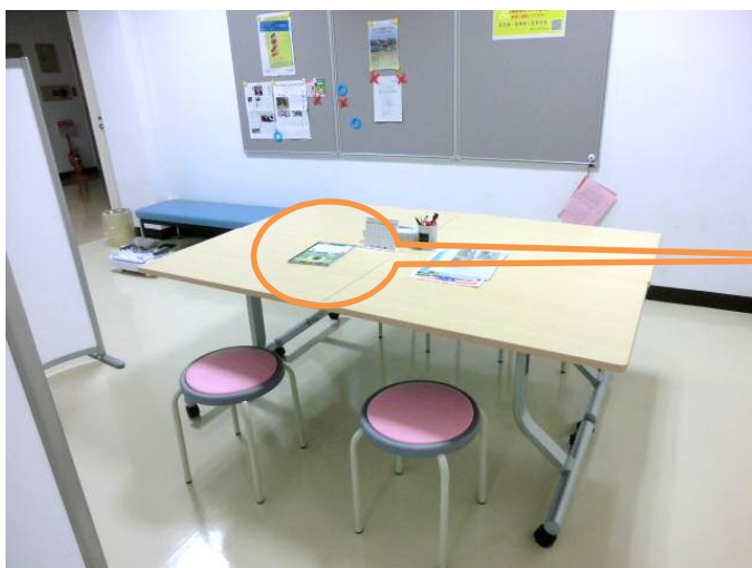
【センターホールには、くつろぎスペース】