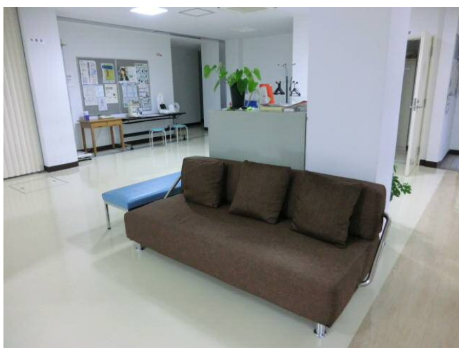
【ゆったりと寝ころんだり♪】