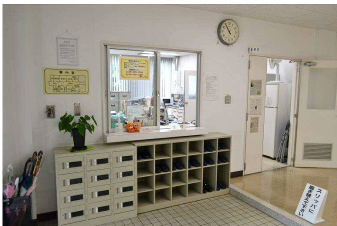
【受付】気軽に相談しやすい雰囲気作りに努めています