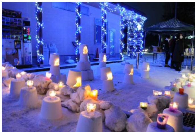
【冬の風景】キャンドルナイト 毎年12月～2月イルミネーションが点灯されてキレイ

こんなのびのびとした秋田大学です。皆さま機会がありましたら、どうぞお越しください。 スタッフ一同お待ちしております♪