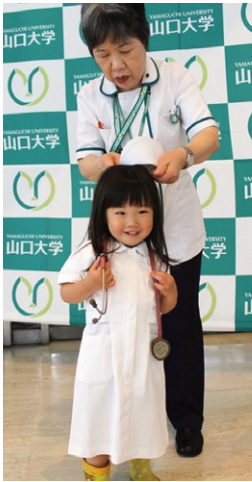
小さな看護師さんも登場