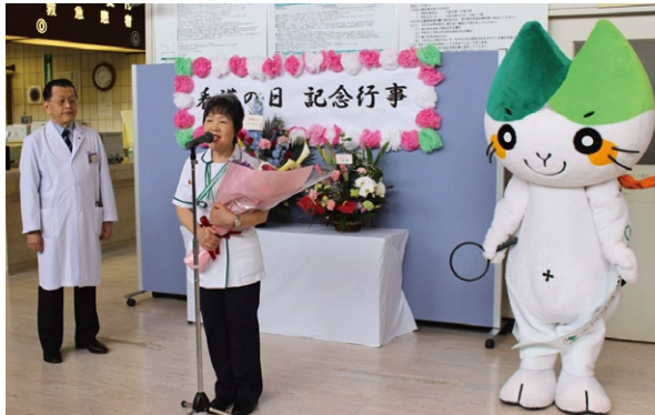
猪上看護部長より挨拶

メイカルスタッフの協力のもと、患者さんや来院された方々を対象に、記念グッズの配布、健康チェック、医療・栄養・福祉の相談、認定看護師による血糖測定、手洗いチェック、ハンドマッサージの実践・指導などを行いました。