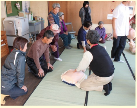
心臓蘇生講習会。もしもの時には「救いたい」気持ちでいっぱいでした。

平郡診療所には、毎年、医学生の地域実習や初期研修の地域研修のプログラムで学生や研修医がお世話になっていることもあり、お礼も兼ねて、昨年12月に住民の方々への健康講習会のお手伝いをさせていただきました。講習会場は東地区の公民館ならびに西地区の小学校跡を使用して合計2回行いました。当日は12月にしては珍しく風