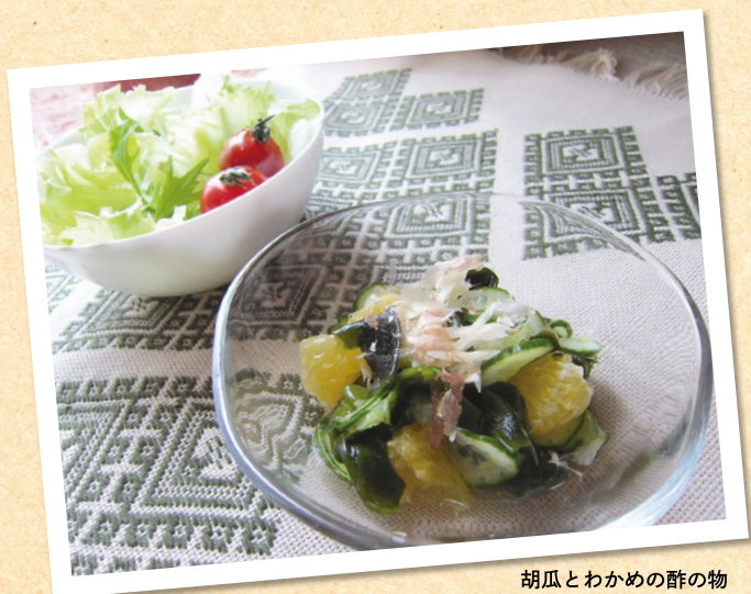
胡瓜とわかめの酢の物 （夏みかん入り）

乳清（50mL）と酢（大 1）、砂糖（小 1）で 合わせ酢をつくる。 輪切り胡瓜（1/2 本）と水戻して絞ったワカメ（10g）、 千切生姜 1g、薄皮を除いた夏みかん（2 房）を 合わせ酢に 15 分漬け込み、器に盛る。 1 人分のエネルギー約 40kcal、塩分 0.2g