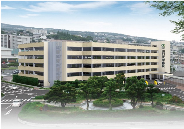
立体駐車場 完成予定図