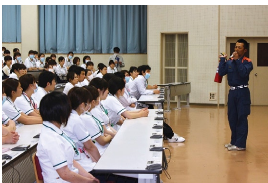
参加者の目は真剣そのもの

火災の初期対応に関するDVD講習が行われた後、レスキュー・キャリアーマットを使用した訓練を行いました。会場内にある屋内消火栓の使用方法的説明後に操作訓練も行い、消火器の操作方法も学びました。