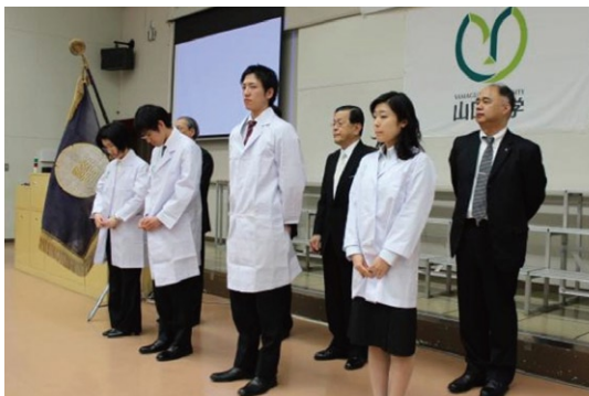
白衣を身にまとった学生代表

5年生全員（123名）へ、Student Doctor（医学実習生）認定証と白衣が授与されました。