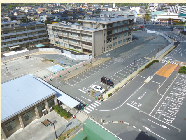
新病棟建設予定地

平成26年10月から実施して完了しました新病棟建設に伴う基幹環境整備が3月末に完了しました。整備期間中は、交通規制や騒音等、ご不便をおかけしましたが、ご協力いただき誠にありがとうございました。今年度の夏頃からは新病棟建設工事が始まる予定ですので、引き続きよろしくお願いいたします。