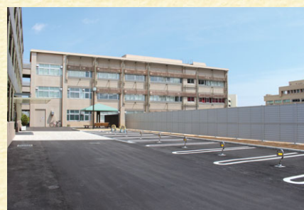
保健学科研究棟前