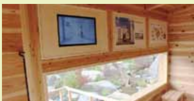
スモールハウス内のパネルとモニターでA棟(新病棟)のご紹介