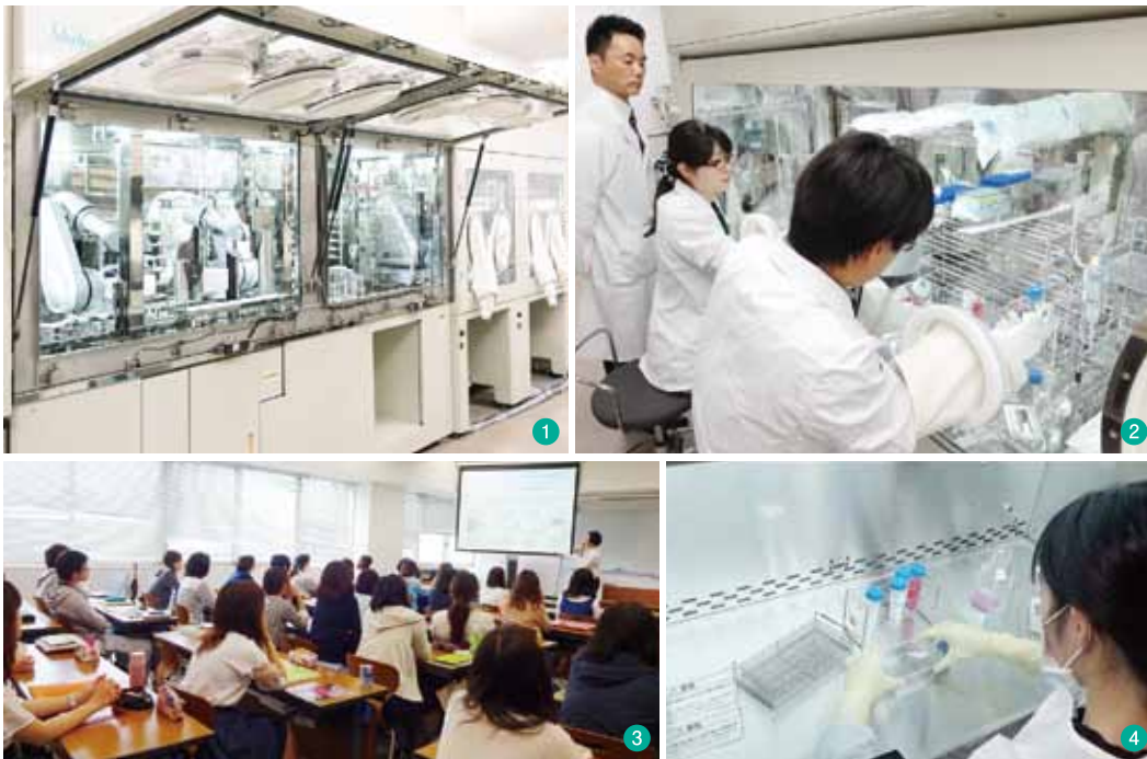
①ロボット細胞培養システムCellPROi(消化器内科学と澁谷工業が共同開発を行い肝臓再生基盤研究室に設置) ②最新のアイソレーターシステムによる細胞培養実習 ③学部3年生を対象とした再生医療の講義 ④臨床培養士養成コースの最終実技試験 ⑤大学院修了式にて ⑥日本再生医療学会学術集会へ大学院生と教員が参加