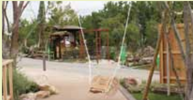
葉っぱをモチーフとした椅子型ブランコ