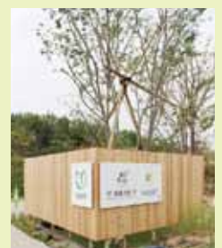
山口ゆめ花博に「健康の庭」を出展