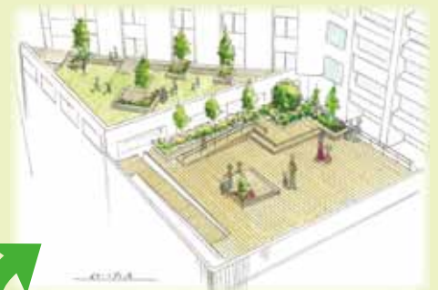
A棟(新病棟)テラスのスケッチ図

「健康の庭」は、山口ゆめ花博閉幕後も常設されることとなりましたので、お近くにお越しの際は是非ご覧ください。 場所/山口きらら博記念公園