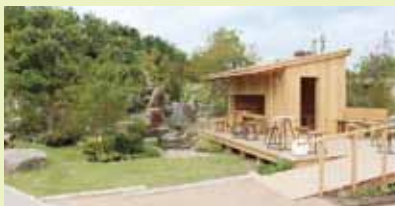
スモールハウスへ続くスロープデッキ