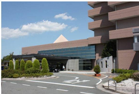
広々として、美しい玄関