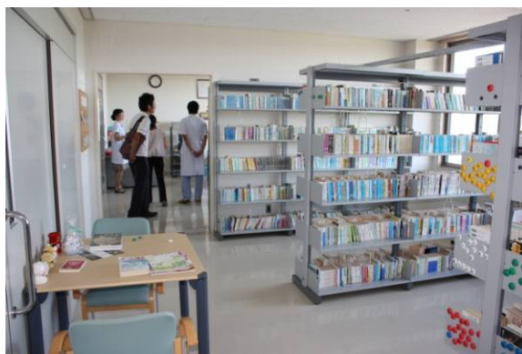
ボランティアによって運営されている図書館（患者さんや家族用）。