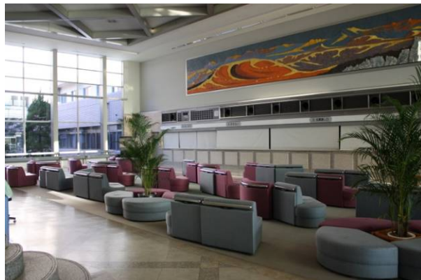
清潔感のある開放的な総合待合。(訪問は午後のため、外来患者はほとんどおらず)