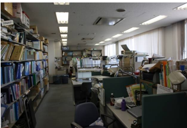
医局。やや乱雑なのは、いずこも同じ！？