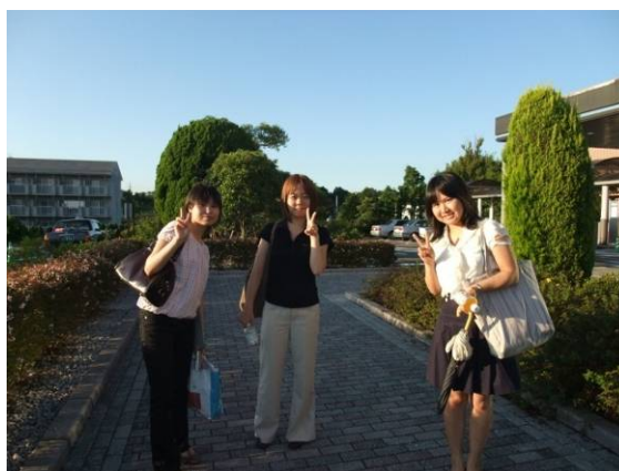
働き隊の第1回訪問も無事終了！ お疲れ様でした！