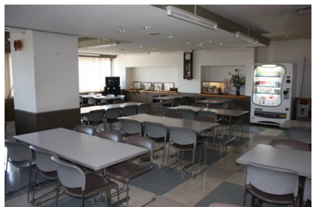
職員用休憩室。食事はここで。