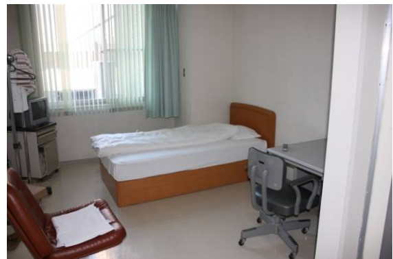
広い当直室（研修医用）。ちょっとした室内運動もできる！？