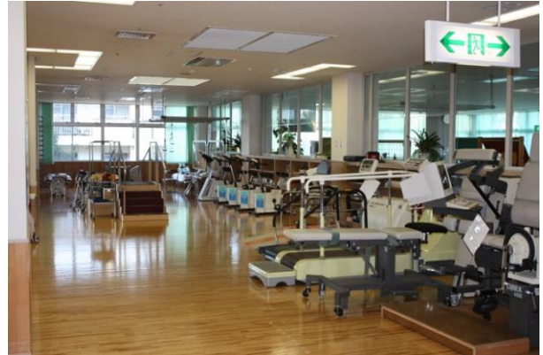
労災病院の得意分野でもあるリハビリテーション室。運動器具は職員の健康管理にも。