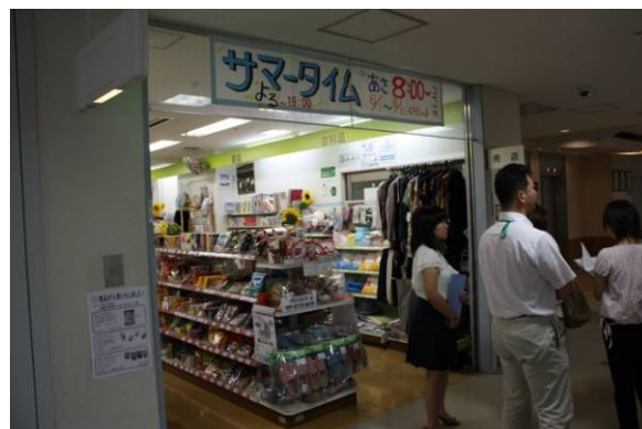
院内の売店。こちらもひととおり揃っています。