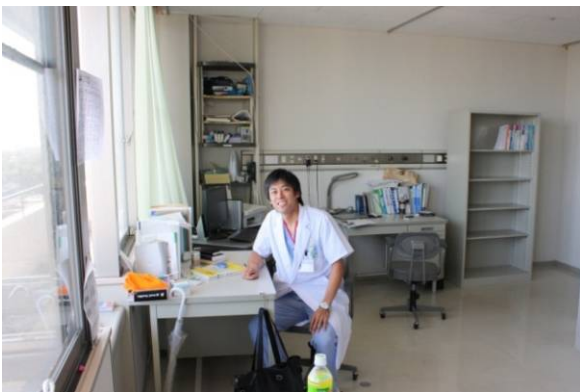
贅沢なスペースのある研修医室。研修医が多すぎないことの利点の一つ。