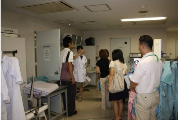
放射線科のスタッフ用スペース。たっぷりとした空間で仕事しやすそう。