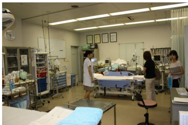
救急処置室。スペースも広めで動きやすい。