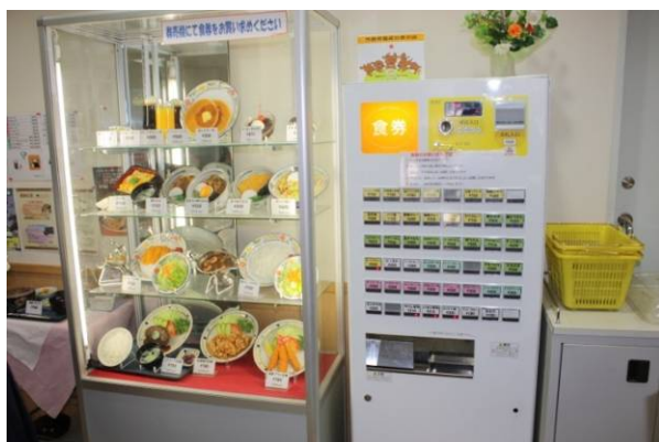
一般用食堂。小さいながらも一通りのメニューは揃っています。