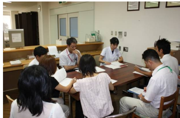
事務職員の方からもヒアリングを行う。(職員用図書館にて)