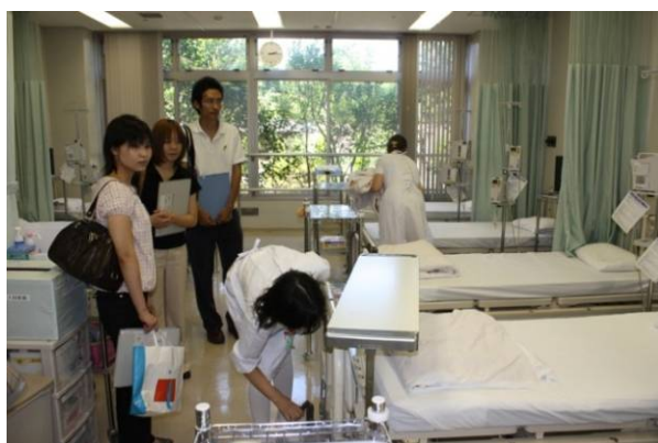
化学療法室。通院で化学療法を行う患者さんのための点滴室。専門看護師が対応する。