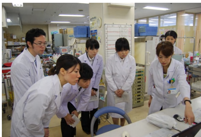
病棟での説明風景