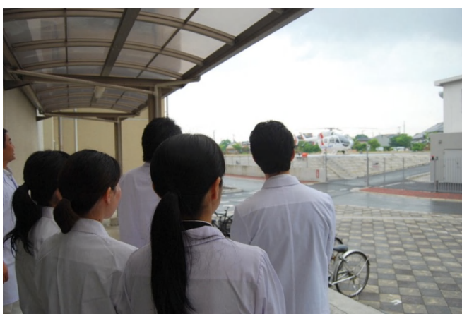
最後にドクターヘリを見学