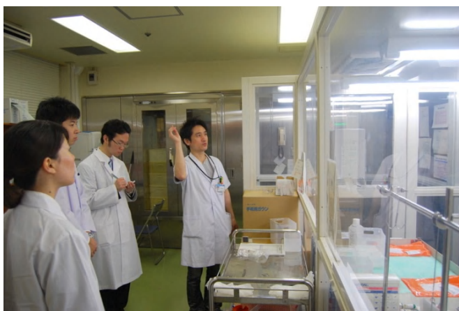
無菌製剤室での説明風景

見学修了後、質疑応答を行い、再び記念撮影をして、予定通り12時に解散しました。皆さん、採用試験で再会しましょう!! (古川裕之)