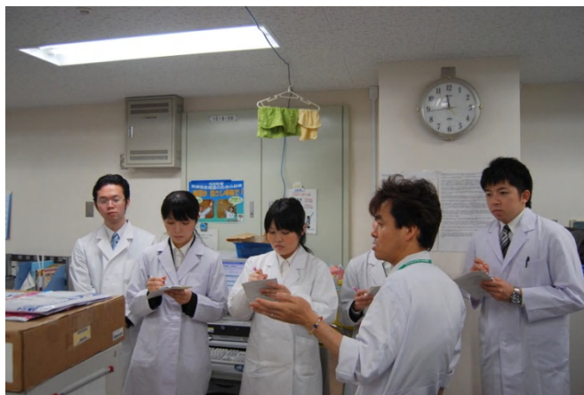
臨床試験支援センターでの説明風景