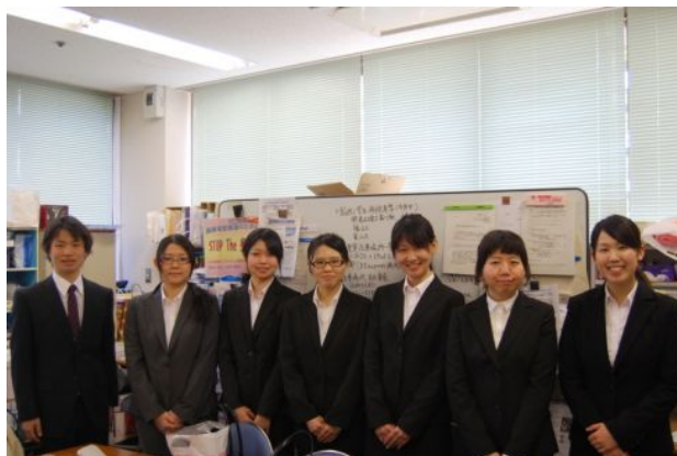
実習終了後の記念撮影