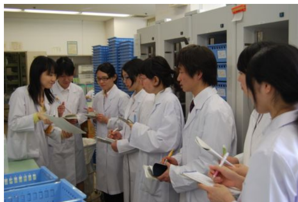
調剤室（注射薬）での説明風景