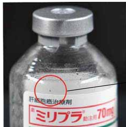
不溶物が認められたバイアルの外観

8月10日(火)からオーダ開始となりましたミリプラ動注用70mgについて、調製後のバイアル内に黒色不溶物(シリコーン系物質)を認めたとの報告が製造販売元の大日本住友製薬からありました。原因について大日本住友製薬が調査中ですが、使用に際しては、調製後のバイアル内及び調製したミリプラチン懸濁液を吸引した注射筒内の不溶物の有無を十分にご確認下さい。万が一、不溶物を認めた場合には、使用せず薬剤部(TEL.2668)までご連絡下さい。