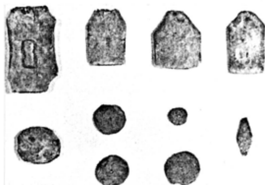
ミニチュア品(祭祀用)