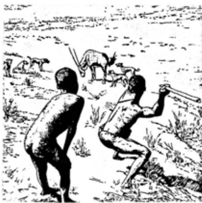
『日本文化の歴史』(1979)所収。

また、墓や調理施設などがある外、動物の骨を道具に作り変えるなど、彼らの生活は野蛮な、その日暮らしといったものではなく、きちっと計算されたものでした。少なくとも、獲物を追って何日も飲まず食わずの生活を送っていたというイメージではありません。現代ほど生活環境は甘くありませんが、夜は一日の疲れをとり、きれいな星ぞらのもと、家族団らん未来の夢を語りあったのでしょうか。