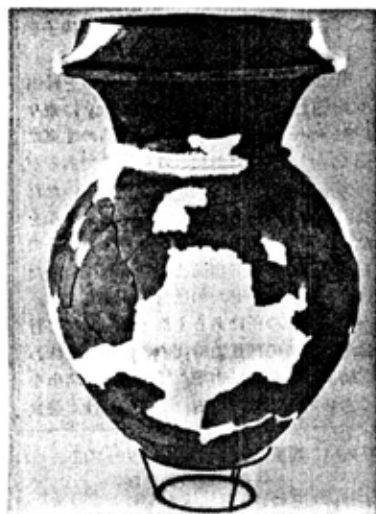
壺の形をした棺 とぐら