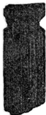
吉田遺跡発見の木簡

幅3.8cm、厚さ5mm。片端は折れ、長さ10cmが残るのみです。赤外線撮影の結果、墨痕は見当りませんでした。木簡の左右に入った切り込みは、木簡を縛りつけるためのもので、おそらく中央への貢進物に付ける荷札(符札)として使われたものです。付札は地方の役所相当施設で取り付けますから、吉田遺跡には古代の役所があった可能性があるのです。今まで山口県内で木簡が出土した遺跡も、長門国府跡、長門国分寺跡、周防国府跡、周防鑄銭司跡など、官庁的性格の濃い遺跡です。