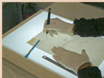
製図ペンは、描く図面の内容によってペン先の太さを使い分けます。