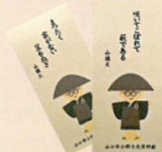
小郡文化資料館オリジナルの山頭火しおり。無料で配布されている。

お問い合わせ先 山口市小郡文化資料館 〒754-0002 山口市小郡下郷 609-3 Tel 083-973-7091 ホームページ http://www8.ocn.ne.jp/~cm-ogori/