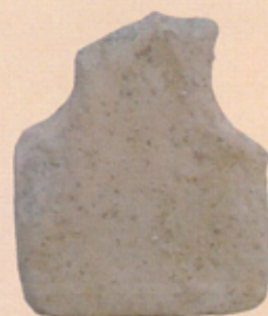
4 吉田遺跡 (総合図書館敷地)