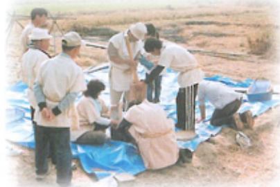
公開授業（第5回授業）の様相