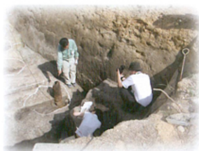
農学部附属家畜病院本調査の記者発表風景