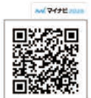
お申し込みはこちら